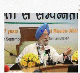
Swachh Amrit Mahotsav 2022

(D) हाल ही में आवास एवं शहरी मामलों के मंत्रालय ने आधिकारिक तौर पर स्वच्छ अमृत महोत्सव शुरू करने की घोषणा की है। यह महोत्सव स्वच्छ भारत मिशन-शहरी के आठ साल पूरे होने पर शुरू हो रहा है। यह 17 सितंबर 2022 से 2 अक्टूबर 2022 तक स्वच्छता को प्रेरित करने के लिए गतिविधियों का एक पखवाड़ा है। यह पखवाड़ा कचरा मुक्त शहर के निर्माण के विज्ञान के प्रति नागरिक कार्रवाई और प्रतिबद्धता पर ध्यान केंद्रित करेगा।